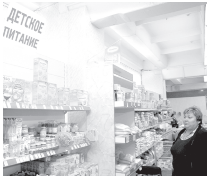
Торговый зал «Базы снабжения» в дер. Кипень