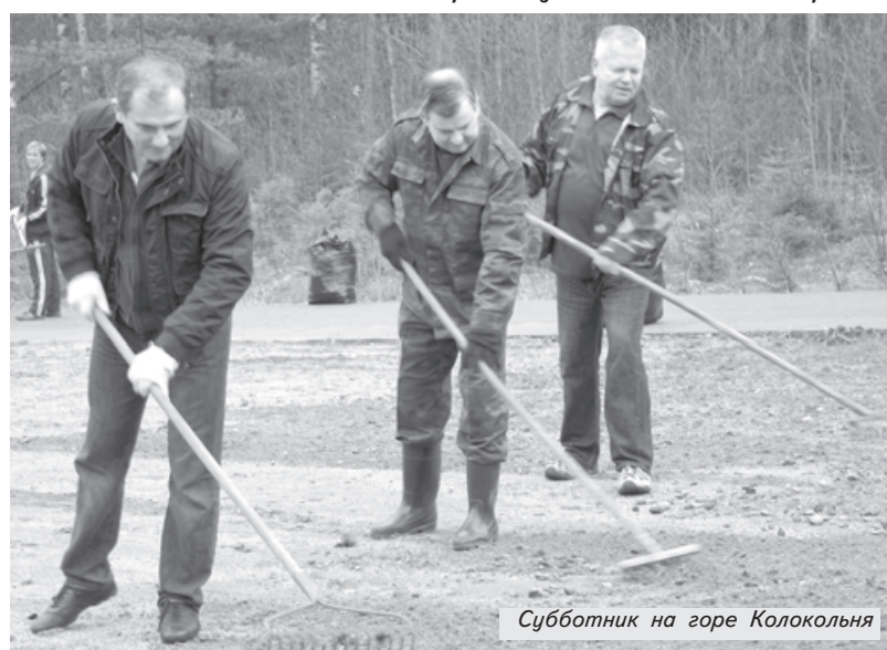
Субботник на горе Колокольня