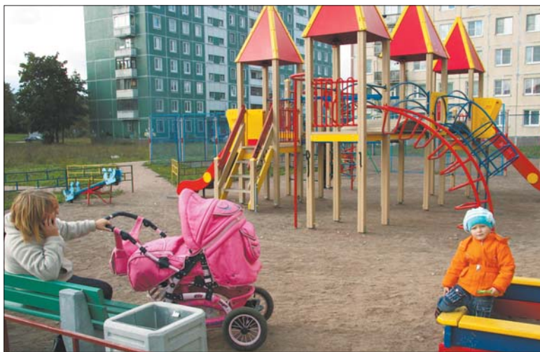
Одна из новых детских площадок в Русско-Высоцком