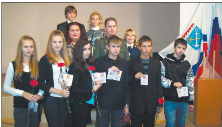
Торжественное вручение паспортов юным гражданам России в Русско-Высоцком