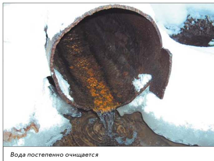
Вода постепенно очищается