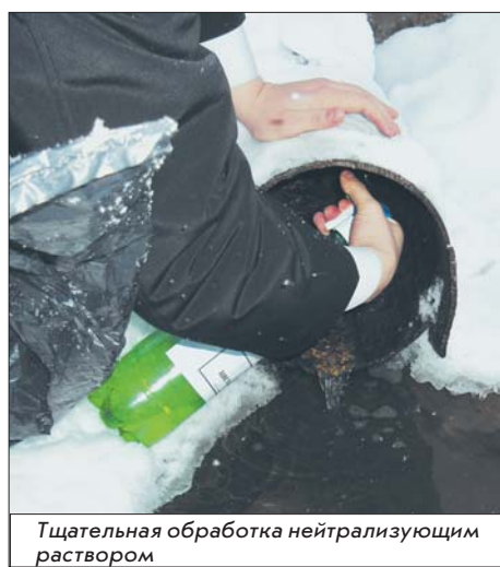
Тщательная обработка нейтрализующим раствором