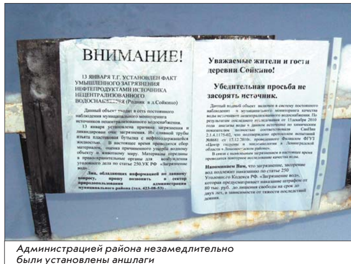
Администрацией района незамедлительно были установлены аншлаги

Скоро весна, и мы вновь будем ждать прилета удивительных, заворающих своей красотой белых птиц и, как и в прошлые годы, любоваться чудом природы. Давайте же отнесемся к ним как к дорогим гостям: позаботимся о том, чтобы лебеди чувствовали себя уютно и спокойно в наших краях!