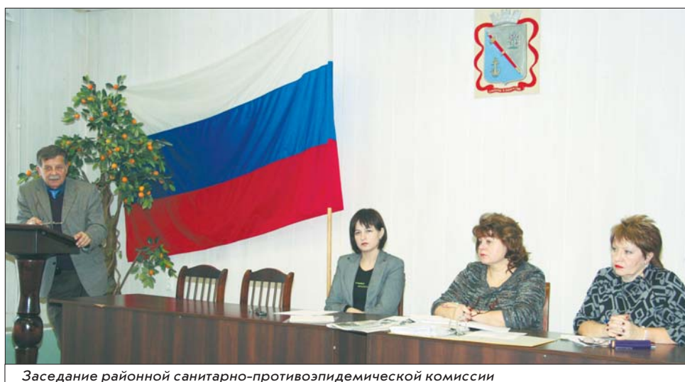
Заседание районной санитарно-противоэпидемической комиссии

ЦРБ, где медицинский персонал постоянно сталкивается с вирусами, уже много лет никто не болел гриппом. Но среди персонала больницы есть люди, которые заболевают практически каждый год. В чем дело? Да просто одни сотрудники регулярно прививаются, а другие (в основном, это не медики) относятся к прививкам скептически.