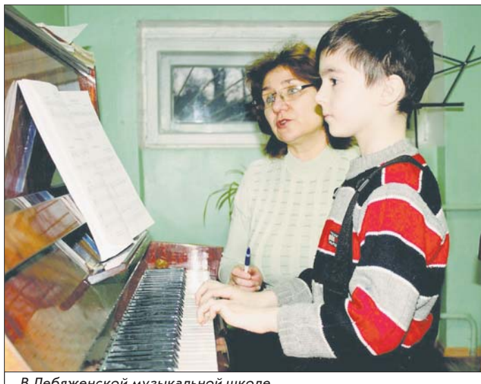
В Лебяженской музыкальной школе