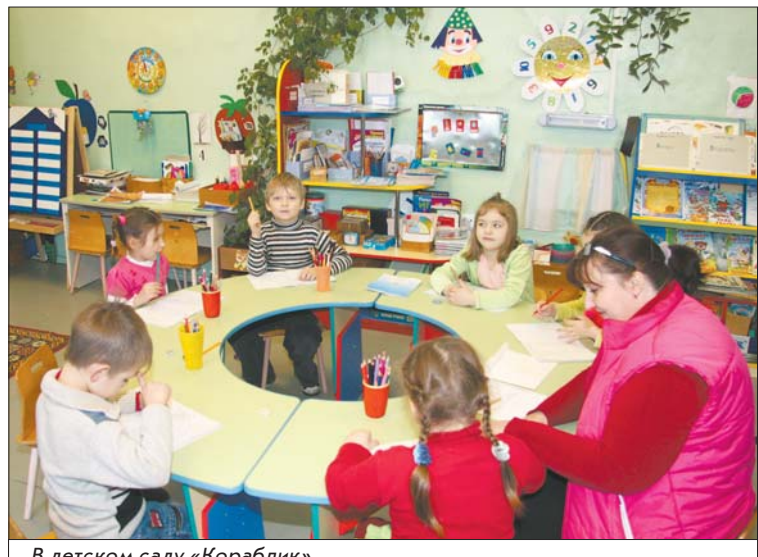
В детском саду «Кораблик»

Что ж, поселок стал постепенно молодеет, и заданий на «завтра» у местной власти много.