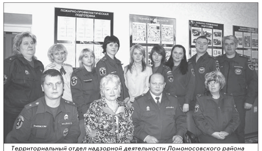
Территориальный отдел надзорной деятельности Ломоносовского района