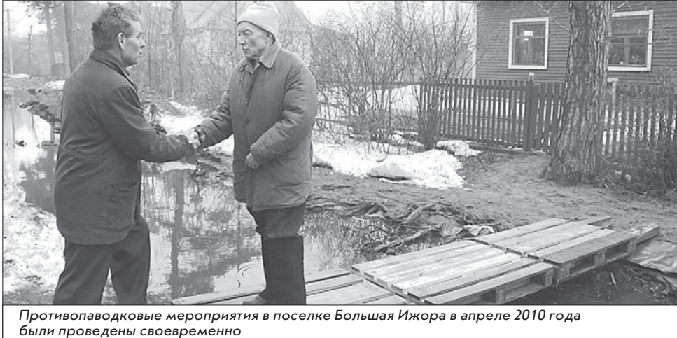
Противопаводковые мероприятия в поселке Большая Ижора в апреле 2010 года были проведены своевременно