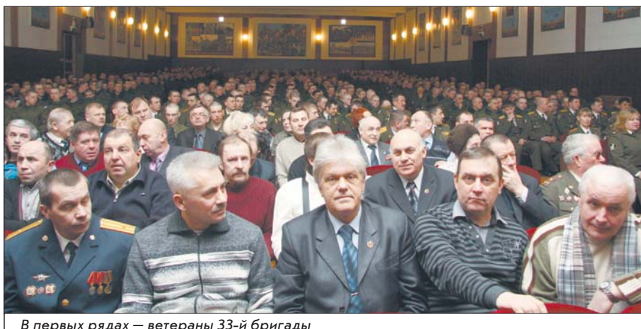
В первых рядах – ветераны 33-й бригады