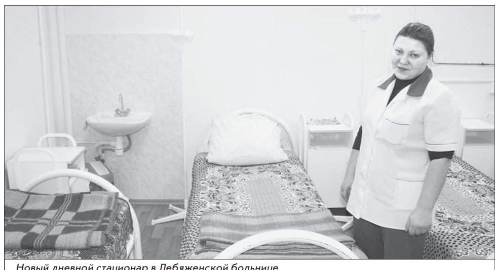
Новый дневной стационар в Лебяженской больнице

В амбулаторно-поликлинической сети в 2010 г. было развернуто 39 коек дневного