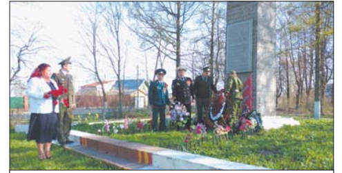
Венки у памятника воинам 2 УА и 42 А в память ликвидации блокады Ленинграда

Следующим мероприятием стало торжественное шествие жителей поселения, ветеранов, воинов и школьников МОУ Русско-Высоцкая СОШ от здания администрации до Дома им. Павла Филимонова. Был организован праздничный митинг, на котором