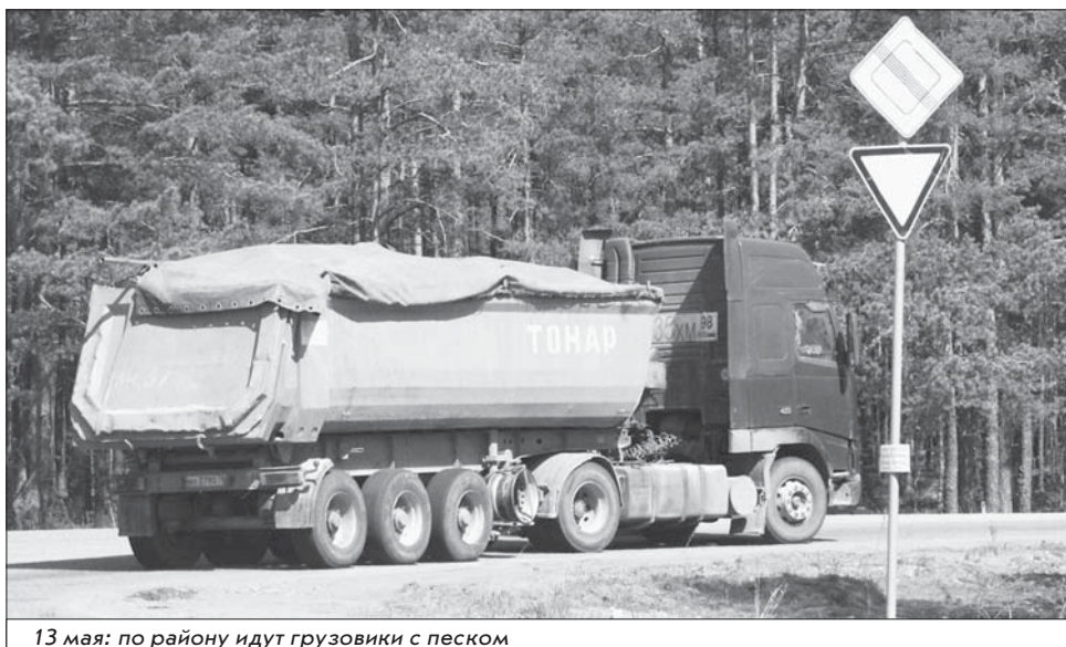
13 мая: по району идут грузовики с песком

продавать не собираюсь, но если бы решил – понес бы вполне ощутимые материальные потери.