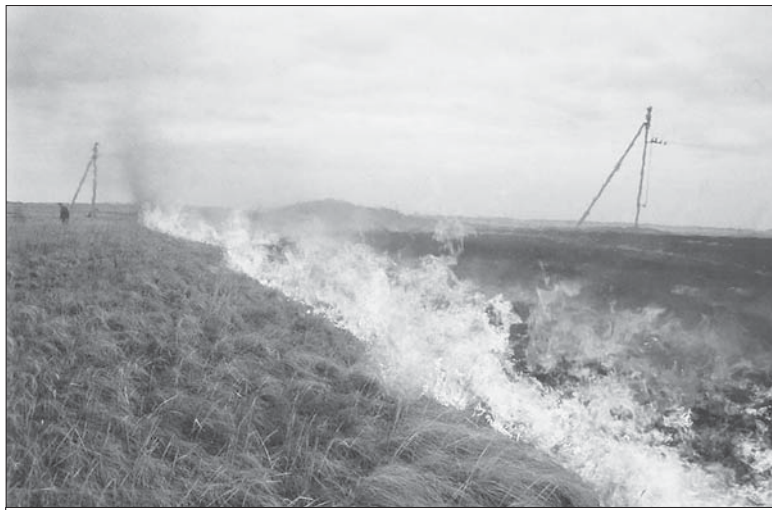
Пал травы — реальная угроза

В.В. Вислогузов отметил, что с 22 мая вступает в силу закон Российской Федерации № 100-ФЗ от 6 мая 2011 года «О добровольной пожарной охране». Фактически добровольные пожарные дружины существуют у нас лишь в Большой Ижоре, Низино и Русско-Высоцком; в этом ряду он назвал также и Пениковское сельское поселение, хотя и с оговорками, что там еще многое предстоит сделать. Пилотный проект по созданию добровольного противопожарного формирования сейчас реализует-