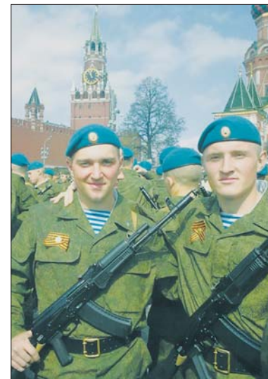
На Красной площади