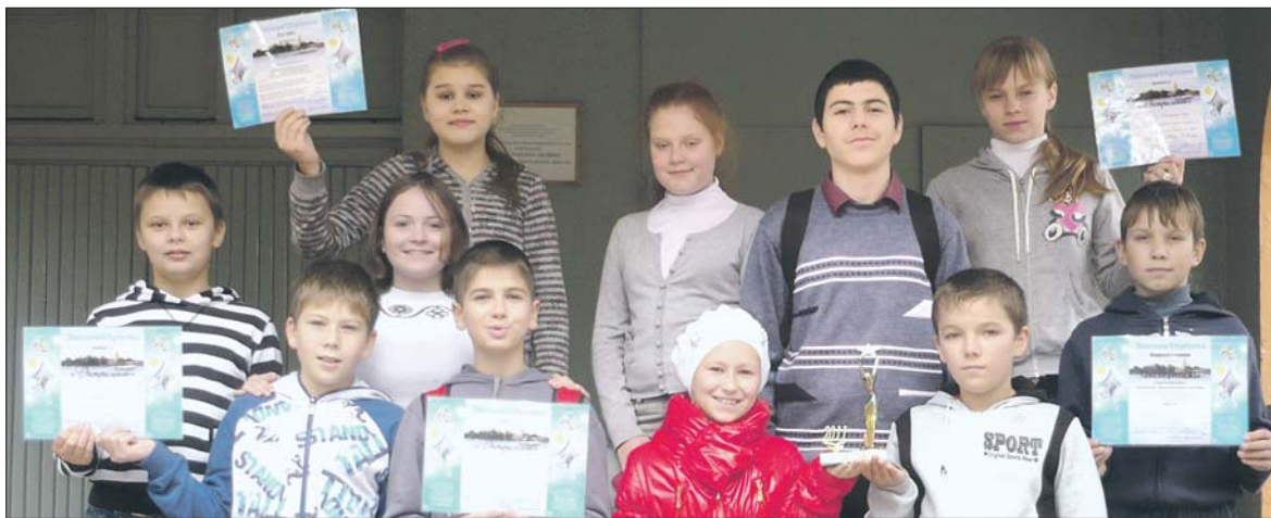
Актеры театра с дипломами и кубком