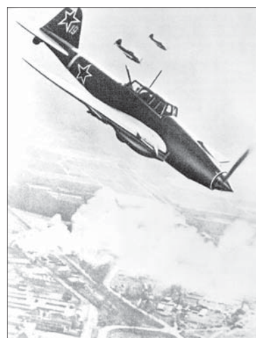
Советские штурмовики Ил-2 наводили ужас на фашистов