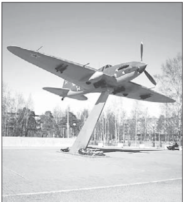
Подлинный самолет Ил-2, поднятый со дна озера и отреставрированный, стал основой для создания мемориала «Защитникам Ленинградского неба» в пос. Лебяжье.