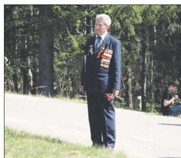
9 мая 2011 года.

Администрация Ломоносовского муниципального района приглашает всех на районный митинг в День Победы 9 мая к 12 часам на площадь у воинского мемориала в деревне Гостилицы. В 13 часов на горе Колокольня начнется праздничное народное гуляние, посвященное 67-й годовщине Великой Победы.