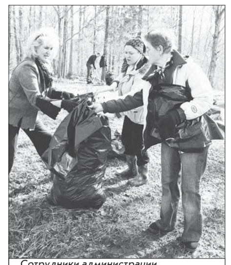
Сотрудники администрации на субботнике по уборке территории, прилегающей к мемориалу на горе Колокольня

Привлечь к созданию благоприятной окружающей среды предприятия района – задача подразделений районной