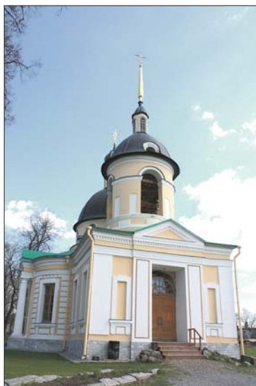
Возрожденный храм Святой Троицы в деревне Гостилицы

Чтобы масштабная реконструкция, посвященная освобождению Ленинграда от вражеской блокады, оставила самые лучшие впечатления, к делу подключились и воинские части с полевыми кухнями, и представители малого бизнеса: они обеспечили горячее питание, выездную торговлю. Мы договорились с «Красной звездой», что такие события будут проходить регулярно. Еще одна историческая реконструкция была приурочена к началу Великой Отечественной войны и прошла 24 июня. У деревни Петровское были возведены блиндажи, землянки, для удобства зрителей мы обустроили зону парковки, зону общепита. Привезли ребят из наших школ, ветеранов из всех поселений – чтобы все они могли пообщаться. В этот же день в Копорском поселении прошел XIII Областной историко-фольклорный праздник «Копорская потеха». В этом году он был посвящен 200-летию Отечественной войны 1812 года.