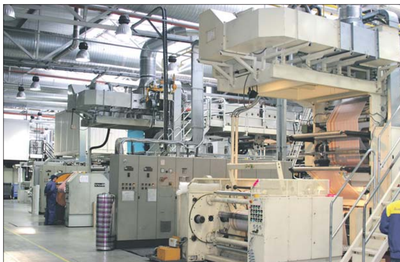
Современные высокотехнологические производства – новейшая страница в истории Ломоносовского района