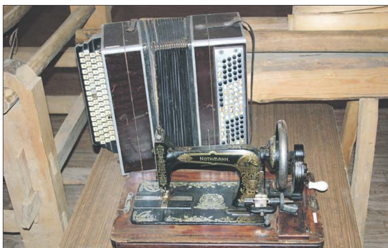
В районном историко-краеведческом музее немало экспонатов, рассказывающих о том, как жили и трудились прошлые поколения жителей земли Ломоносовской

Как только не называлась наша земля за свою длинную историю! Работники районного историко-краеведческого музея дали нам маленькую справку: с 1100 г. по 1323 год наши земли можно было отнести к Киевской Руси; с 1323 по 1478 гг. – это Водская пятна Великого Новгорода; потом, до 1581 года мы относились к Великому княжеству Московскому. Дальше, с небольшими перерывами вплоть до 1703 года на некоторой территории нынешнего Ломоносовского района, в том числе, в Копорье, располагалось Шведское королевство, утвердив Ингерманландское герцогство. Далее, с 1780 по 1796 – это Ораниенбаумский уезд Санкт-Петербургской губернии Российской империи, а потом, вплоть до 1917 года и до 1923 года – Петергоф-