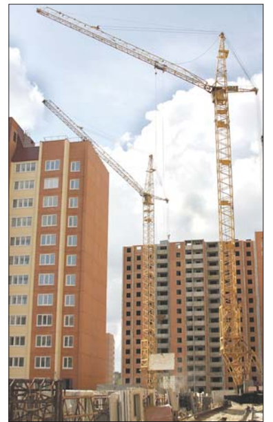
Ломоносовский район – лидер по строительству жилья в Ленинградской области

– У Ломоносовского района есть планы по продвижению туристических зон?