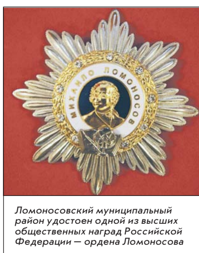
Ломоносовский муниципальный район удостоен одной из высших общественных наград Российской Федерации – ордена Ломоносова

Статья подготовлена по материалам сотрудников районного историко-краеведческого музея и отдела экономики администрации Ломоносовского района