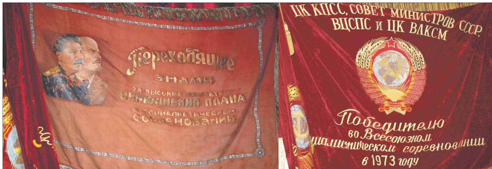
Наши земляки славились своими трудовыми победами: эти переходящие красные знамена завоеваны лучшими производственными коллективами в социалистическом соревновании. В историко-краеведческом музее Ломоносовского района создан специальный Знаменный зал. С историческими стягами маршем проходят знаменосцы на особо торжественных собраниях, символизируя преемственность поколений

На территории Ораниенбаумского плацдарма тоже мало что осталось: основной скот еще в