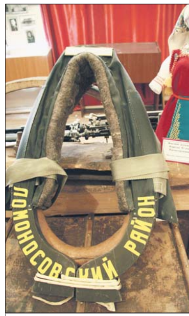
Подарок коллектива Мариинского театра труженикам Ломоносовского района