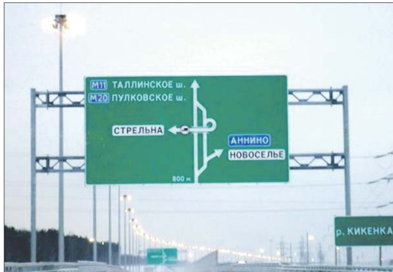
Завершение строительства КАД стало мощным импульсом для притока новых инвестиций в Ломоносовский район

Реализуются интересные проекты в сельском хозяйстве. Экоферма «Купол» активно ведет деятельность в новом для района направлении животноводства – разведение мелкого рогатого скота. В Гостилицах планируется реализовать проект по строительству птицефабрики. Позднее это же предприятие рассчитывает открыть животноводческую фер-