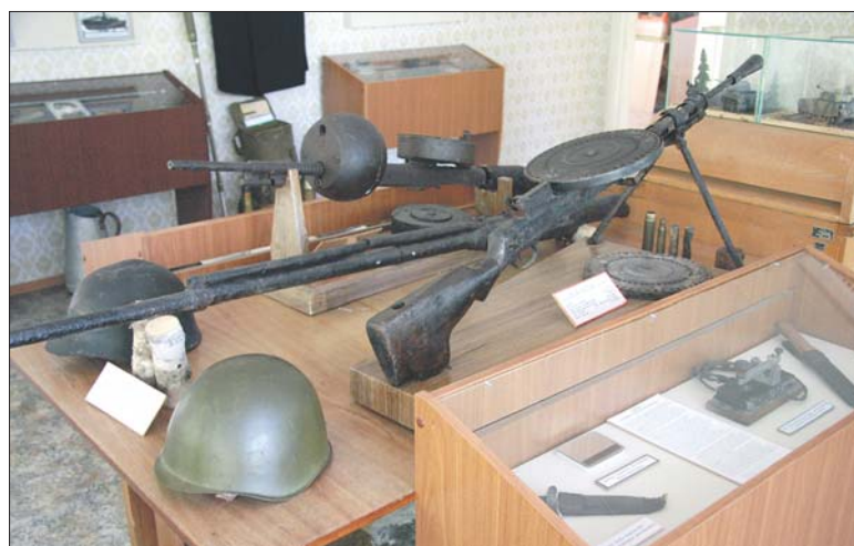
Реликвии военных лет заставляют нас задуматься о героизме защитников Ораниенбаумского плацдарма

Зато, как бы ни менялись государства, административное деление и названия – из рода в род на этой земле жили русские и ижора, воевая и чудь, давая вечные названия рекам и озерам, деревням и урочищам. Вечным был и их труд, преобразующий эту землю. И если веками, сколько и жили тут люди (а в этих краях было множество деревень – до 1941 года – 168 населенных пунктов), образ их труда менялся мало – крестьянские хозяйства, занимавшиеся хлебопашеством, животноводством, рыболовством, традиционными ремеслами; то с наступлением новой эры – Советской власти – ор-