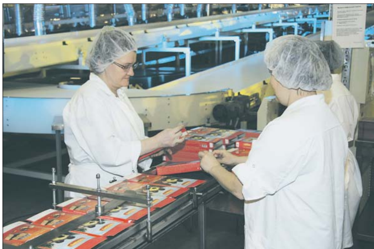
В районе растут объемы промышленного производства, формируются новые промзоны для размещения предприятий

Кроме того, развитие транспортного сообщения будет стимулировать работу порта Бронка, что также немаловажно для развития нашей экономики.