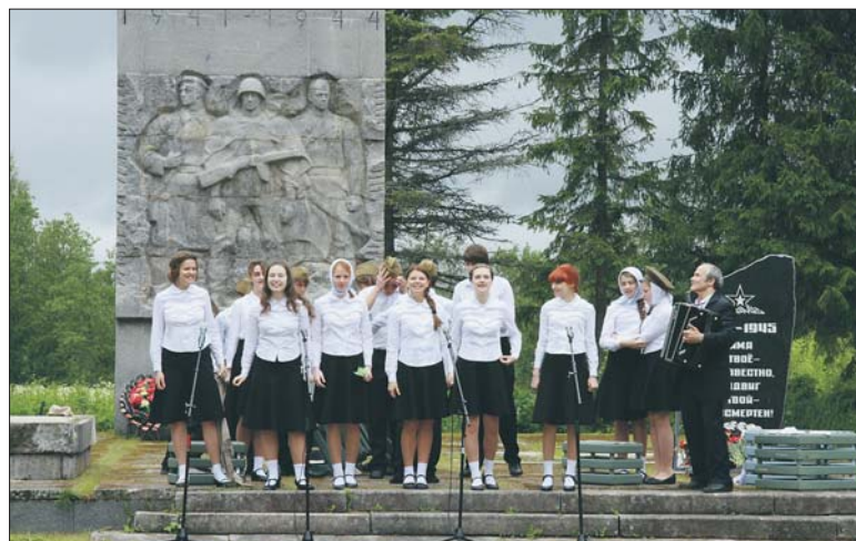
Военно-историческую реконструкцию предвворяла композиция «Песни военных лет», представленная детской театральной школой «Рубикон»

– У нас очень много сельских домов культуры было отремонтировано за минувший год. Вошел в программу реконструкции ДК в Аннинском поселении. Отремонтированы дома культуры в Лаголово, Лопухинке, Оржицах, Гостилицах. У нас почти нигде не было проблем, кроме дома культуры в Русско-Высоцком, но и на него нам удалось найти средства. Объект вошел в программу реконструкции сельских домов культуры, сейчас делается проект, и я думаю, что в следующем году мы будем торжественно перерезать ленточку на его открытии. Кстати, в Русско-Высоцком будет не просто Дом культуры, а «Дом дружбы