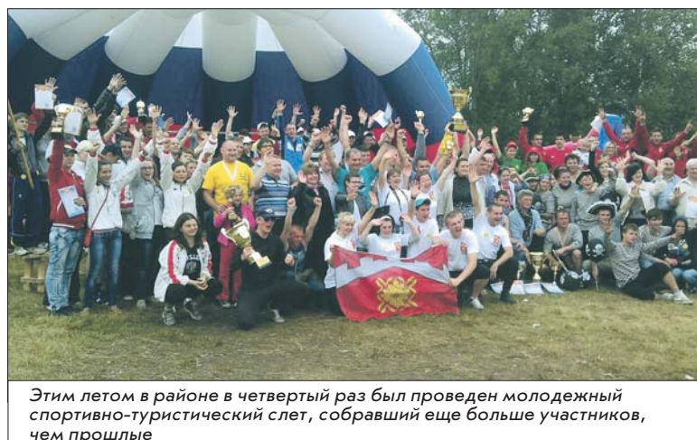
Этим летом в районе в четвертый раз был проведен молодежный спортивно-туристический слет, собравший еще больше участников, чем прошлые

народов Ленинградской области». Он станет центром притяжения не только для жителей Русско-Высоцкого поселения и Ломоносовского района, но и всей Ленинградской области.