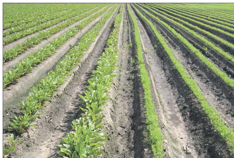
Сельское хозяйство остается основным направлением в экономике района; в аграрно-промышленном комплексе широко применяются новые технологии