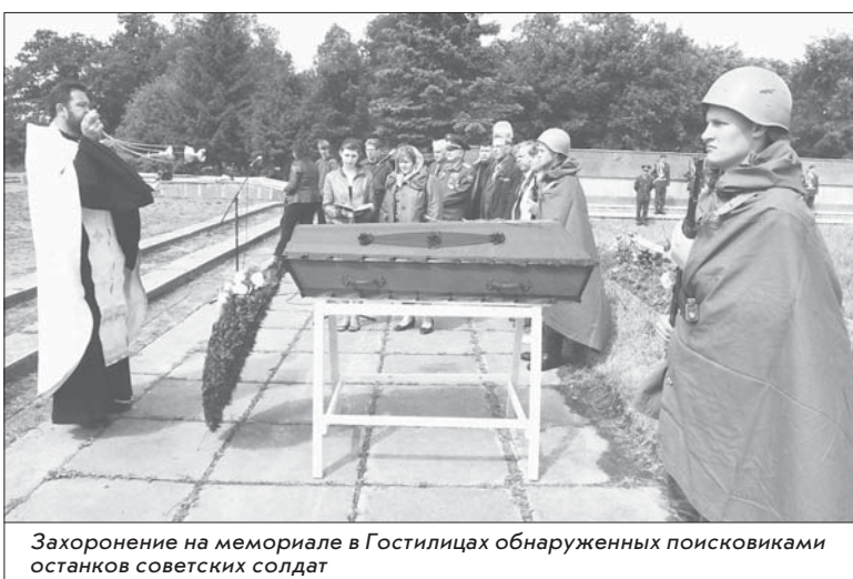
Захоронение на мемориале в Гостилицах обнаруженных поисковиками останков советских солдат