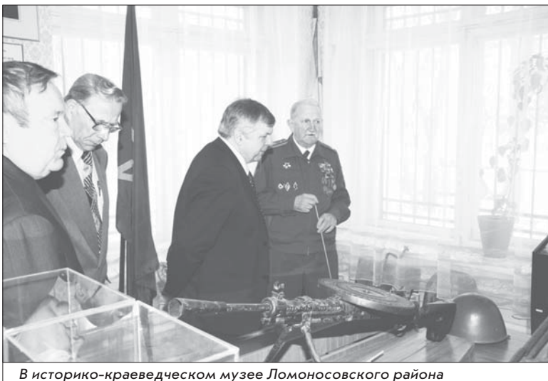
В историко-краеведческом музее Ломоносовского района