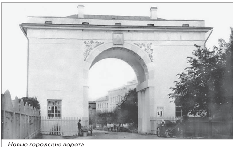
Новые городские ворота

3. Заслуживает внимания ещё одно имя: адмирал Павел Васильевич Чичагов (1767-1849, сын адмирала Василия Яковлевича Чичагова), назначенный в 1802 году Морским министром. Как и многие адмиралы екатерининской, александровской и николаевской эпох, часто совершавших поездки из Петербурга в Кронштадт, Павел Чичагов имел дачу в окрестностях Ораниенбаума (современный ориентир – железнодорожная платформа Кронколония). Приблизительно с 1810 года и до середины 1820-х годов Павел Чичагов владел здесь обширным участком – это место со второй половины 19-го века