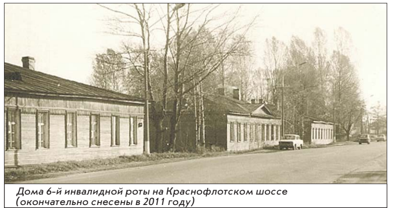
Дом 6-й инвалидной роты на Краснофлотском шоссе (окончательно снесены в 2011 году)