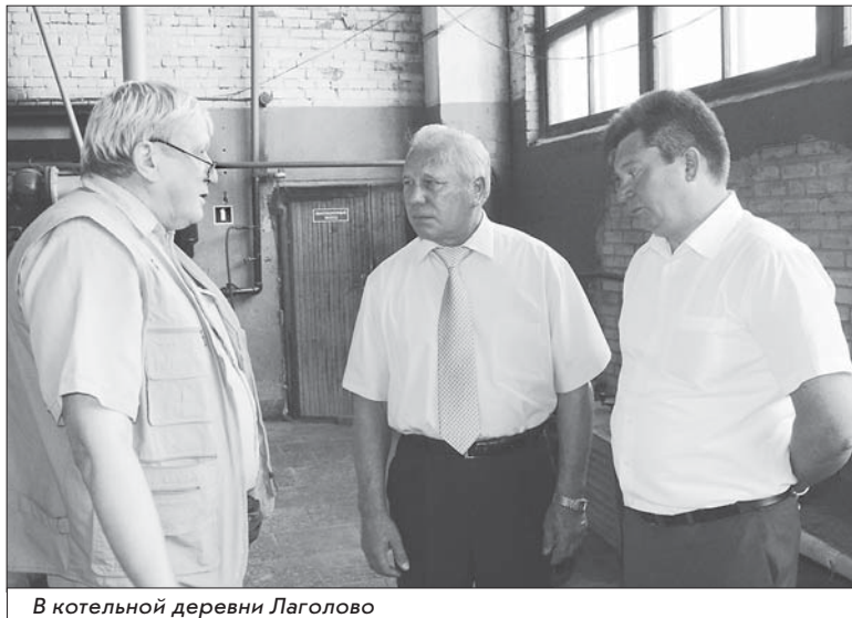
В котельной деревни Лаголово