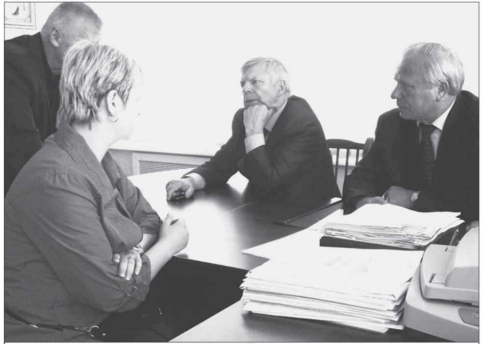
Выездной прием граждан в Ропше