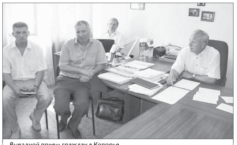
Выездной прием граждан в Копорье