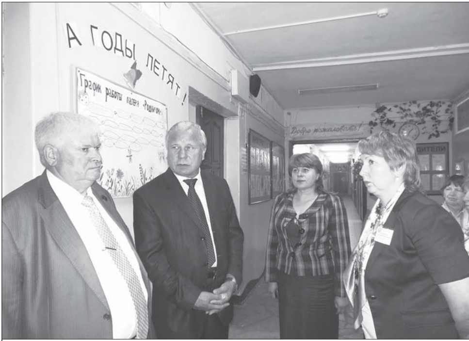
В Ропшинской средней школе