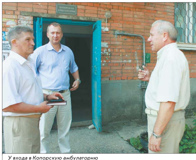
У входа в Копорскую амбулаторию