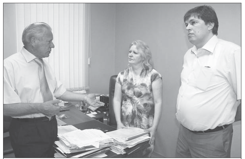
Посещение ООО «Венеция»

ние лаголовцев на любви к книгам и привила любовь к родному краю через исследование его истории.