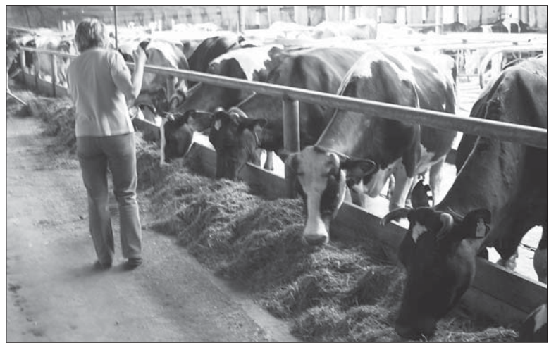
Ферма «СХП Копорье»