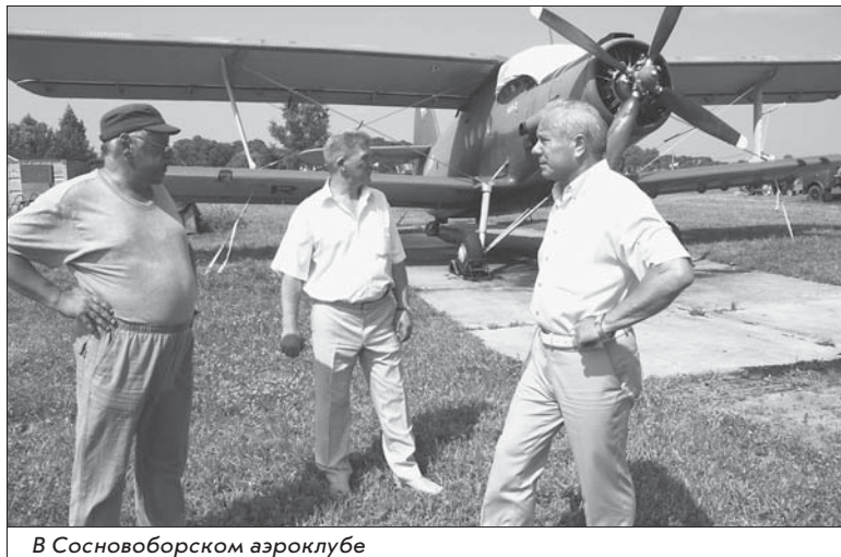
В Сосновоборском аэроклубе