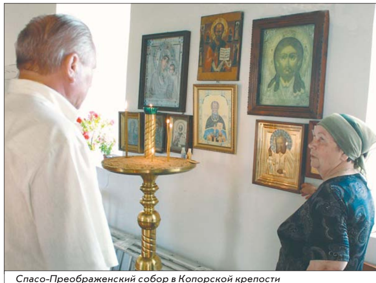
Спасо-Преображенский собор в Копорской крепости