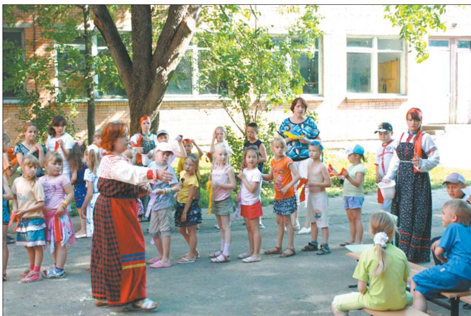
Завершение смены летнего лагеря