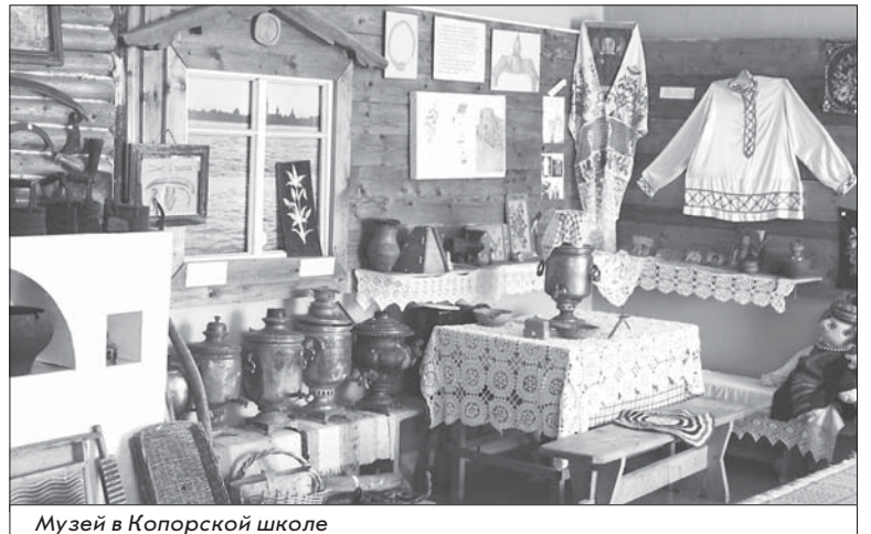
Музей в Копорской школе