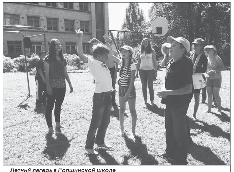
Летний лагерь в Ропшинской школе

Большая проблема Ропши – детский сад. Он расположен в деревянном здании, и по предписанию пожарных на втором этаже группы закрыты. Поэтому здесь могут принять только 20 детей, что очень мало для Ропши. Очередь – огромная. Детей возят в детсады окрестных деревень, в то же Яльгелево. Поселение заявлено в областную программу по строительству детского сада, вы-