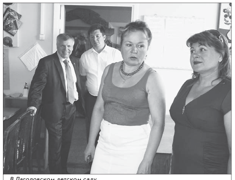
В Лаголовском детском саду