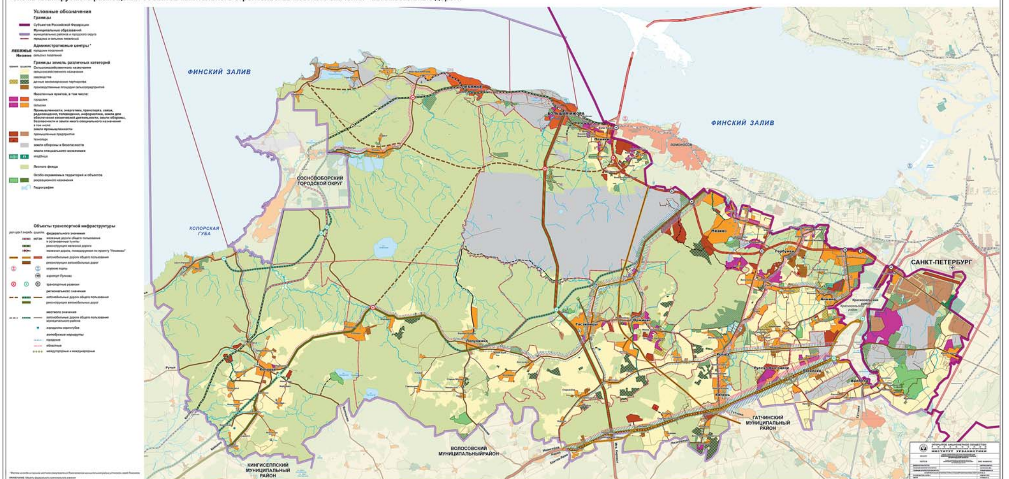
Схема планируемого размещения объектов капитального строительства местного значения - автомобильные дороги