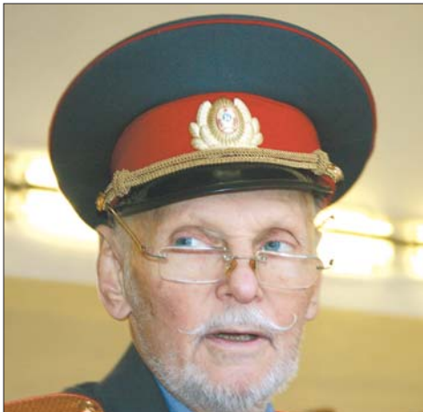
Пришлось сыграть строгого полицейского

После летних каникул резко увеличивается число происшествий на дорогах – гибнут дети. Театр придумал и провёл в физкультурном зале «Школу дорожных наук». Классные руководители младших и средних классов привели своих учеников. Ребята, соблюдая правила, ездили на велосипедах и самокатах, учились правильно переходить дорогу. Мне пришлось сыграть строгого полицейского... Разработанный сценарий разослали по школам района, чтобы коллеги «не изобретали велосипед».