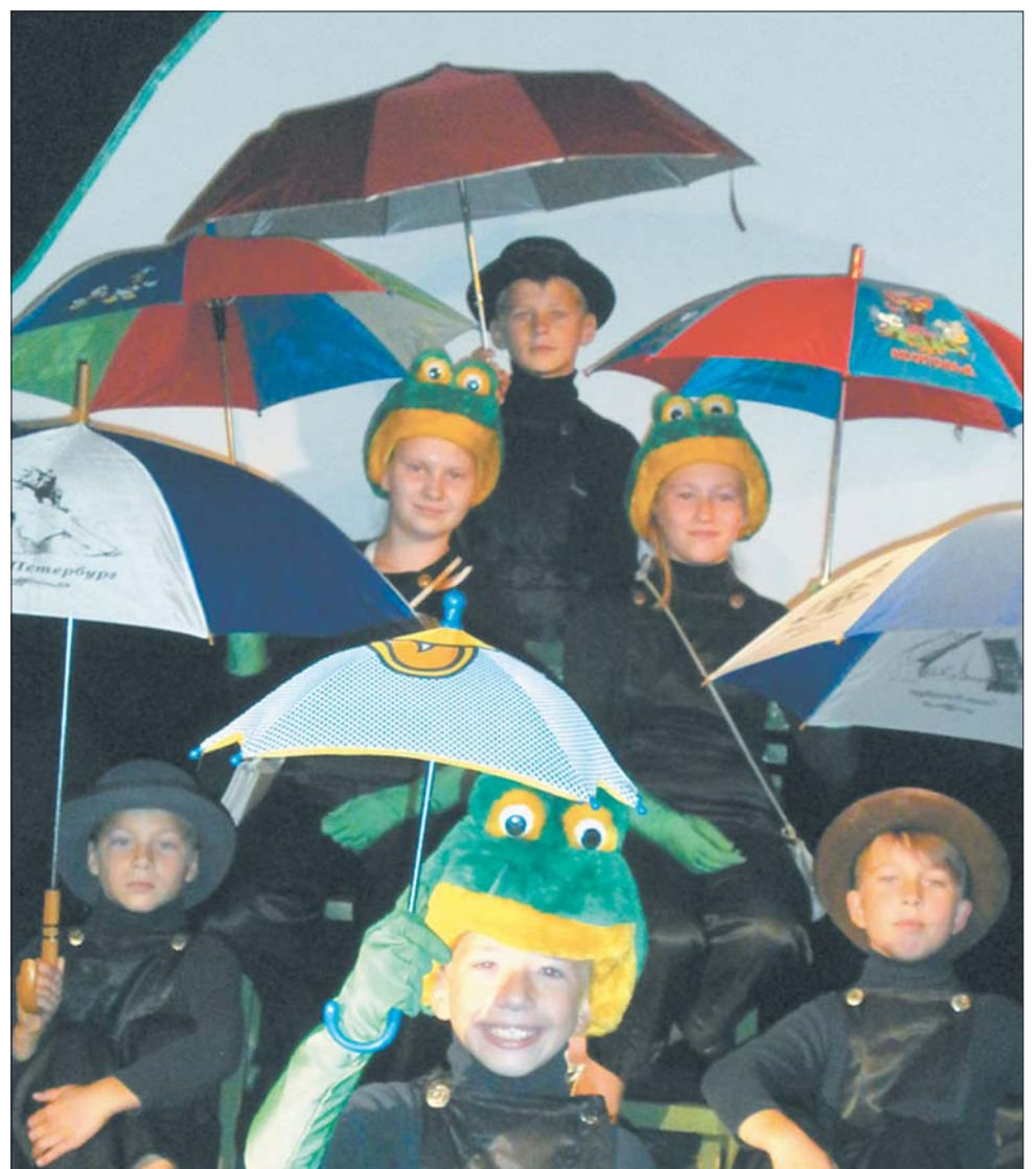
Сцена из нового спектакля