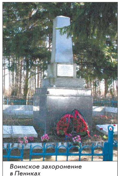
Воинское захоронение в Пениках