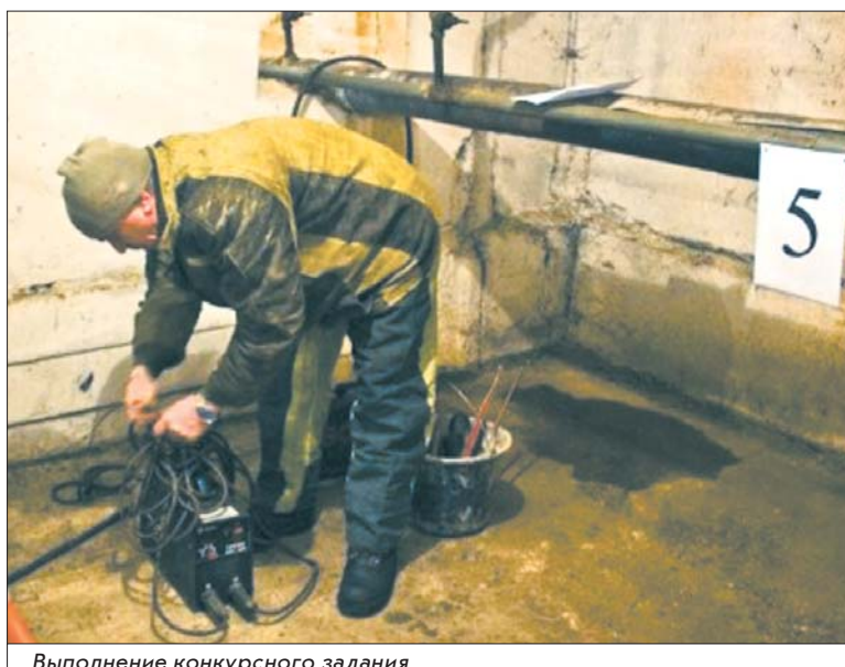
Выполнение конкурсного задания