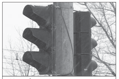
Не работают светофоры в Большой Ижоре и Низинском сельском поселении