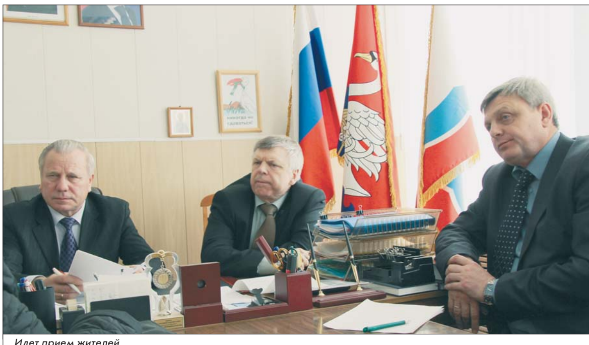
Идет прием жителей