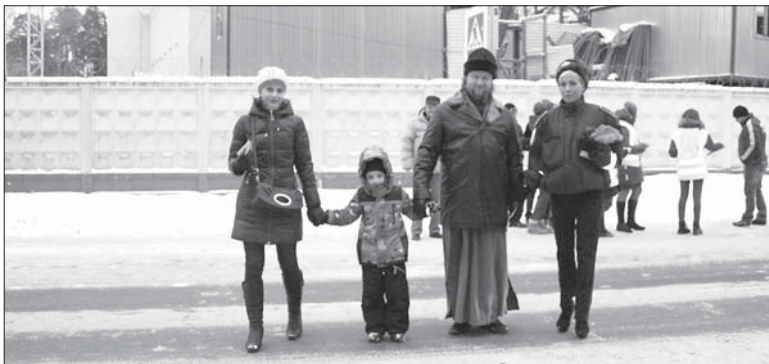
Акция ГИБДД и общественности в п. Лебяжье, направленная на привлечение внимания к безопасности пешеходных переходов