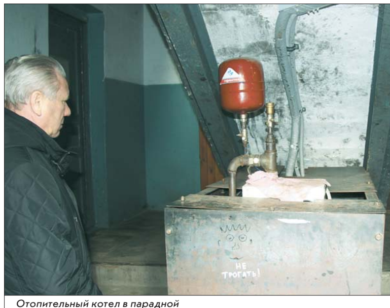
Отопительный котел в парадной