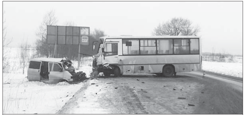
ДТП на участке автодороги «Ропша – Яльгелево» с участием автобуса ОАО «АТП-31»

В очередной раз главы местных администраций высказали претензии в адрес перевозчиков. Особенно много недостатков было отмечено в работе нового перевозчика, ОАО «АТП-31», пришедшего в наш район с начала 2014 года. Поскольку автобусы этого предприятия уже успели побывать в ДТП, появились вопросы к руководству «АТП-31» и у районного ОГИБДД. На заседании комиссии со всех сторон было слышно: раньше, когда на 639-х маршрутах работали машины индивидуального предприя-