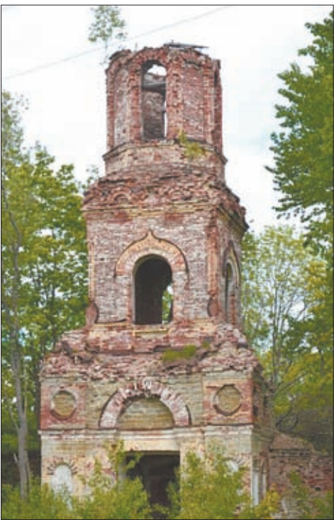
Троицкая церковь в Старых Медушах ждет своего возрождения

Я твердо усвоила, что вокруг много таких мест, «Троицких», и повелось это с Петра I. Аргумент про Петра воспринимался безоговорочно: мы «с пелёнок» знали, что Петр Великий основал Петергоф и Петербург. Петр разгромил шведов, причем воевали целых двадцать лет (ну, понятно – не было танков, самолетов и «катюш»). Про Петра двухсерийный фильм сняли, и там был Алексашка Меншиков. Меншиков построил громадный Ораниенбаумский дворец с садом и парком. А фильм про Петра часто показывают в летнем кинотеатре (он смахивает на сарай, зато там прохладно и комфортно, и находится он поблизости от нашей слободы – в Нижнем саду, наискосок от Меншиковского дворца)... Примерно так происходило мое приобщение к истории. Всё вместе – семья, дом, город, край, страна. Всё сразу – день сегодняшней, недавняя война и седая старина. Знания передавались от дедов-прадедов внукам-правнукам, и происходило это легко и естественно, если они жили на одной земле, хранившей следы и приметы разных эпох. Из поколения в поколение переходила «память предков» – наше наследие.