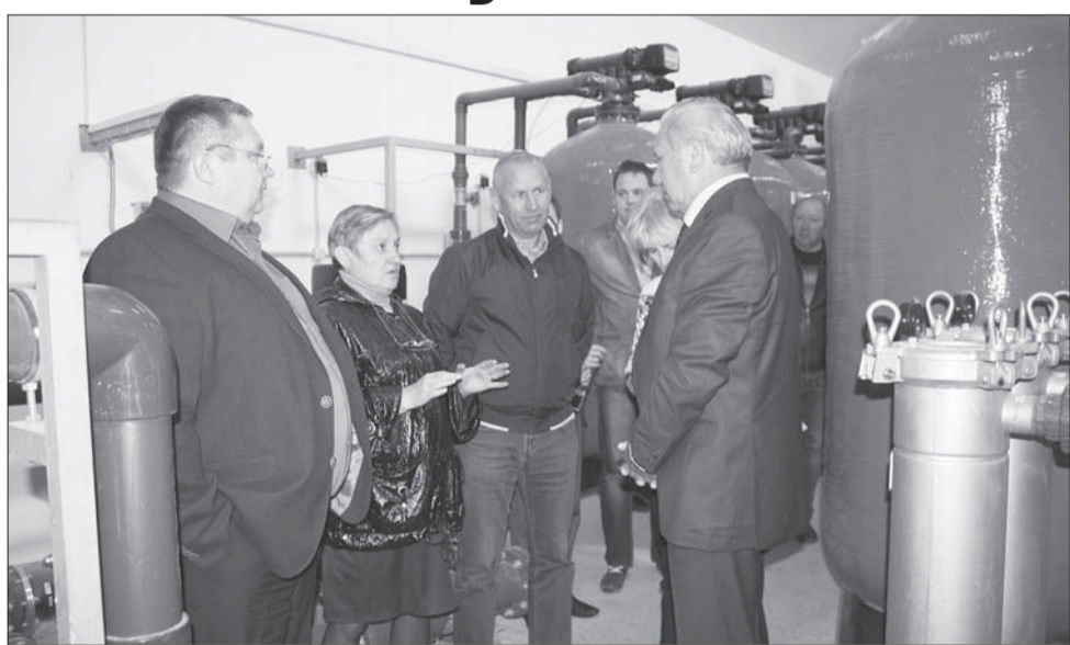
В котельной с новым оборудованием

Вернемся в Малое Карлино. Гордость местного депутатского корпуса и администрации — отвоеванная от угрозы закрытия Нагорная основная школа. Здесь заменены ВСЕ окна (нет у нас в районе больше школь-