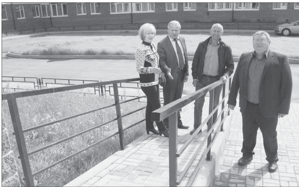
В новом доме — всё удобно