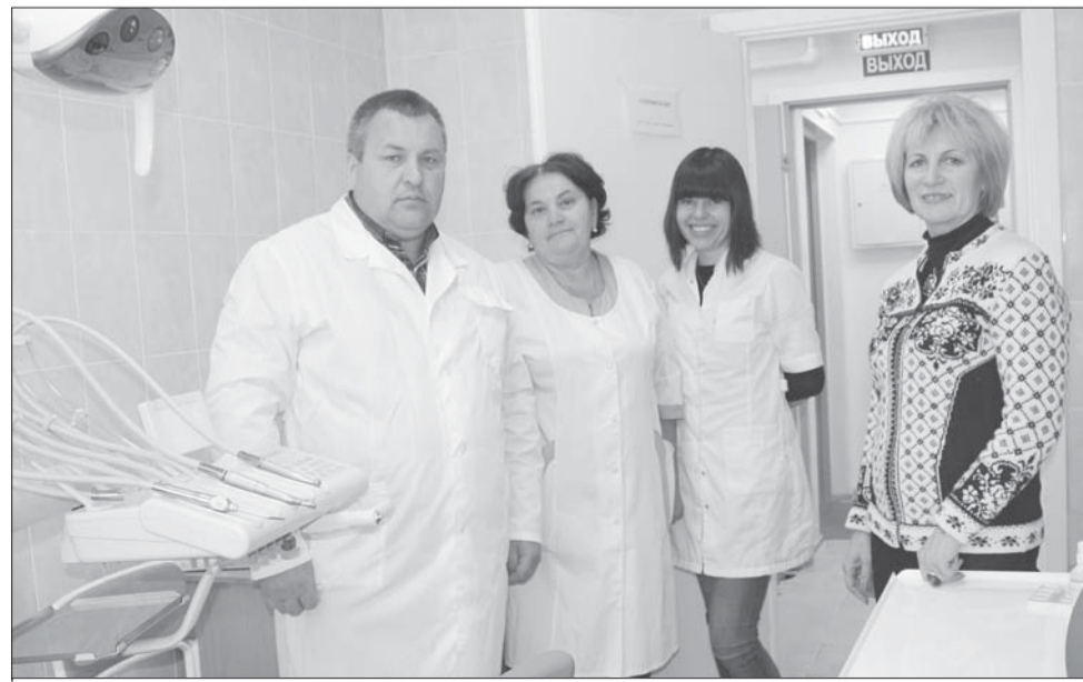
Новый стоматологический кабинет в Малом Карлино