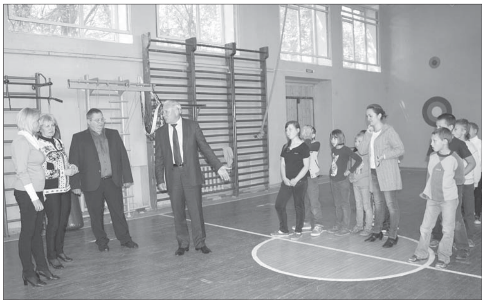
Отремонтированный спортзал Нагорной школы