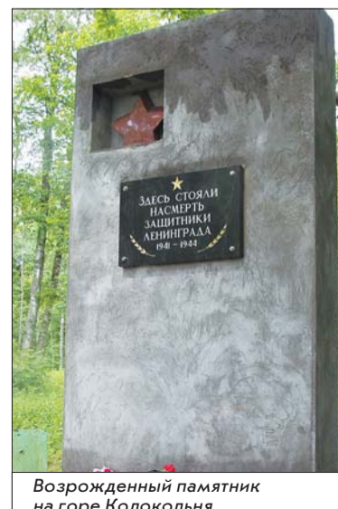
Возрожденный памятник на горе Колокольня