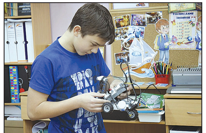
Низино: секция робототехники.