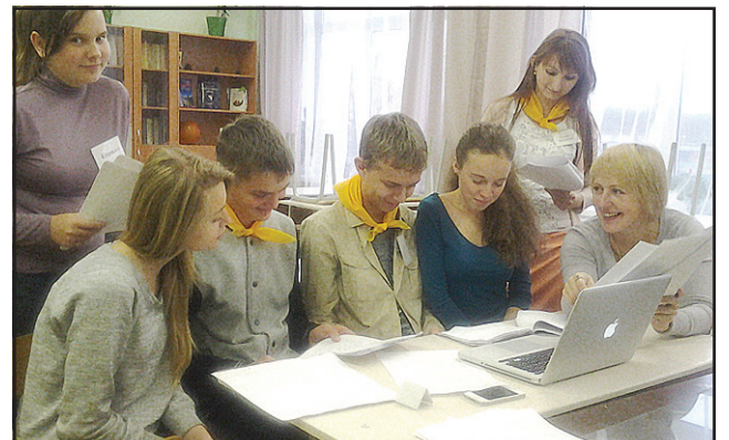
Работа с режиссером – озвучка.