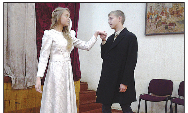
«Герой нашего времени» в Ломоносовской школе №3