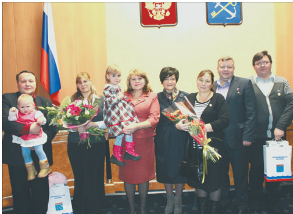
Делегация Ломоносовского муниципального района в Доме Правительства Ленинградской области на празднике в честь Дня матери