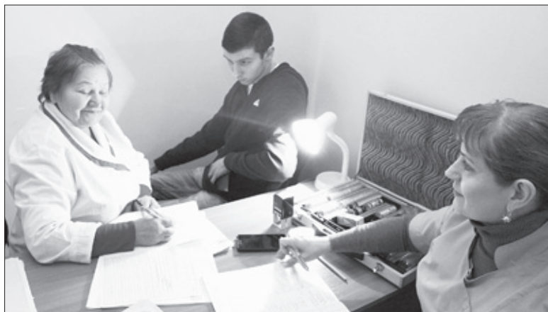
На медицинской комиссии