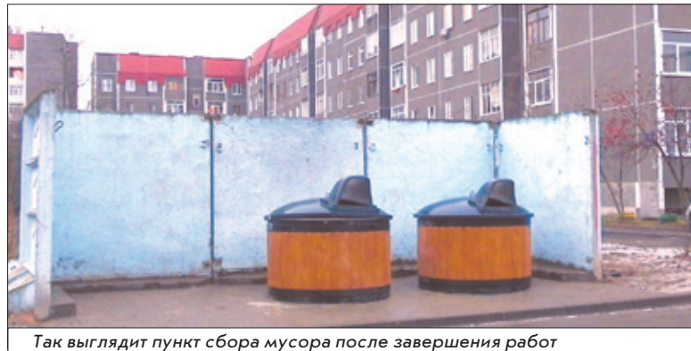
Так выглядит пункт сбора мусора после завершения работ