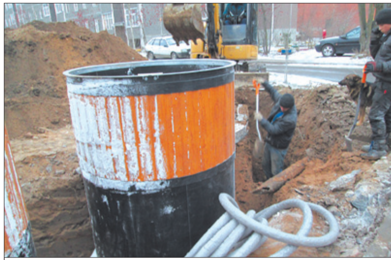
Установка мусорного контейнера на ул. Институтская

В новом комплексе все удобно. Теперь жителям, особенно детям и пожилым людям, не придется ломать голову, как забросить в контейнер пакет с мусором. При их сооружении соблюдаются санитарные и градостроительные нормы. Заглубленные в землю контейнеры