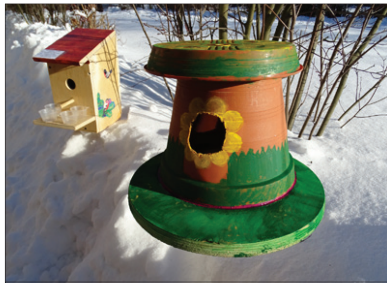
Кормушка-победитель, автор Арина Степаненко, Яльгелевская школа

Надежда КИР ДЕЕВА