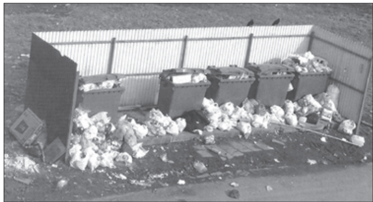
Снимок сделан 29.03.2015

29 марта жители Русско-Высоцкого сообщили в газету о том, что село завалено мусором.