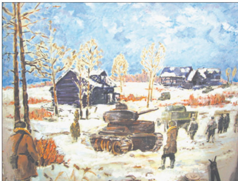
Бой за Гостилицы – картина в музее Боевой славы Гостилицкой школы