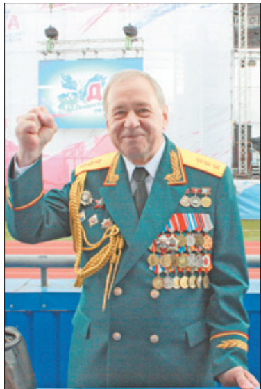
Павел Алексеевич Лабутин – депутат Законодательного собрания Ленинградской области от Ломоносовского района – Почетный гражданин Ленинградской области