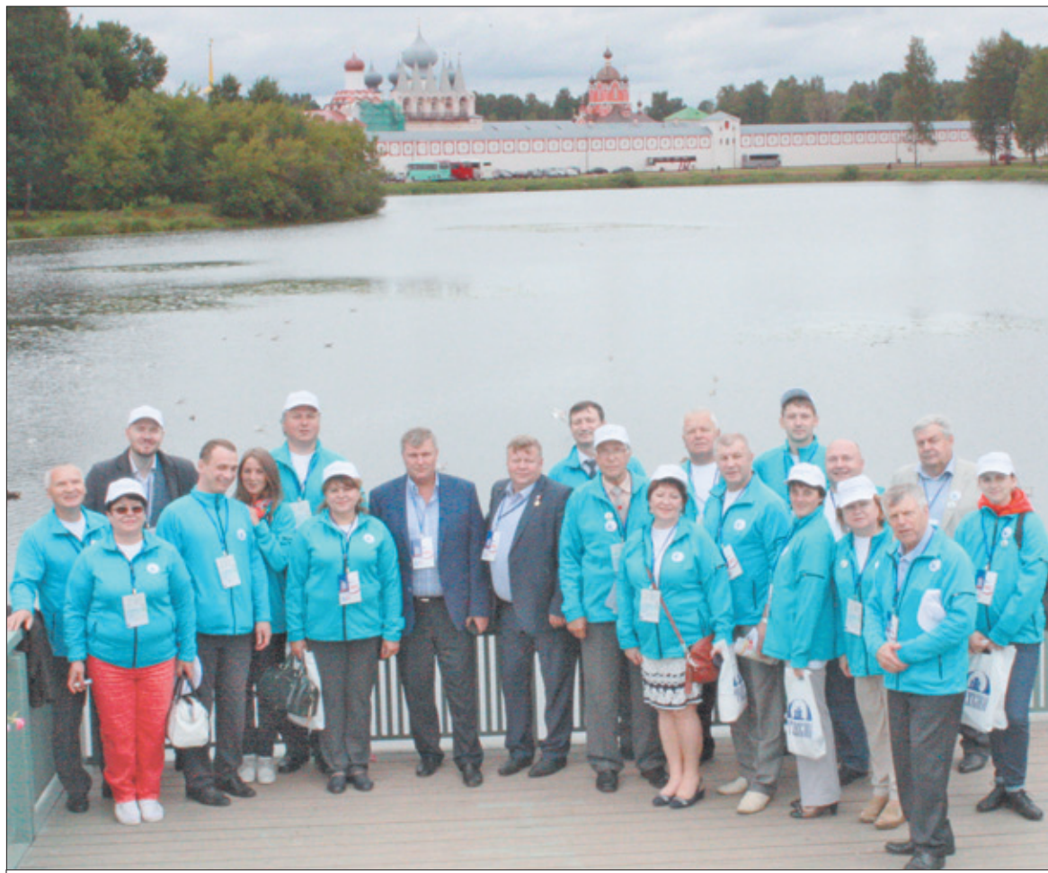
Делегация Ломоносовского муниципального района на берегу реки Тихвинки