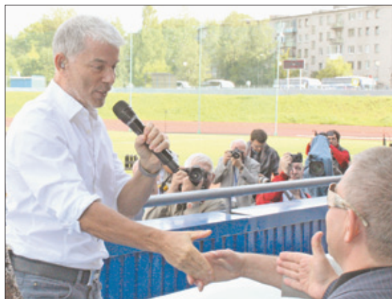
Народный артист Российской Федерации Олег Газманов «пошел в народ»