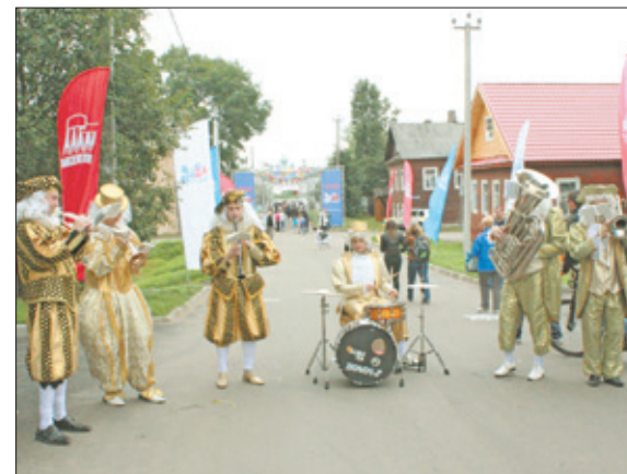
На улицах Тихвина – вся гамма красок и палитра музыки!