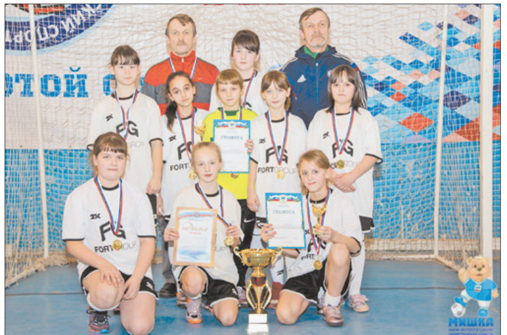
Футбольная команда девочек из Копорской средней школы 2004-2005 г.р. – чемпион Ленинградской области 2016 года.