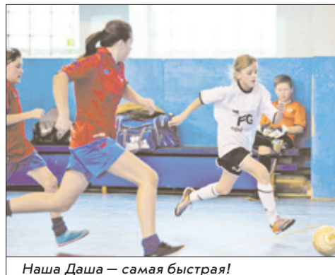
Наша Даша – самая быстрая!