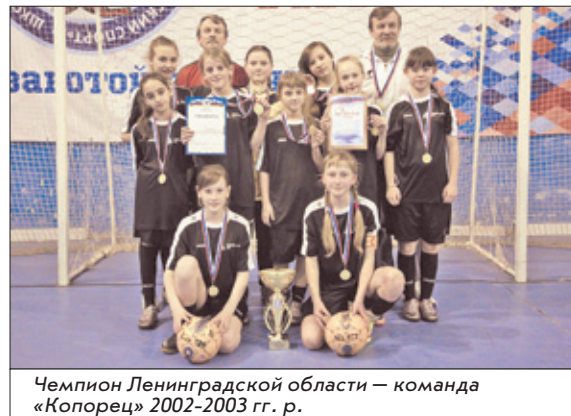
Чемпион Ленинградской области – команда «Копорец» 2002-2003 гг. р.