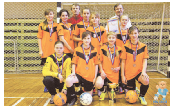
Бронзовые призеры Ленинградской области – команда «Копорец» 2000-2001 гг. р.