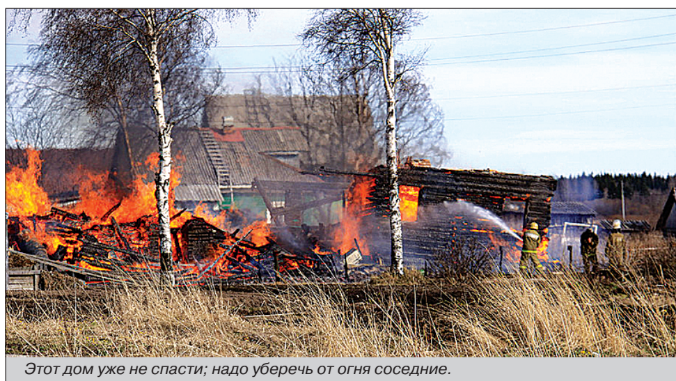
Этот дом уже не спасти; надо уберечь от огня соседние.