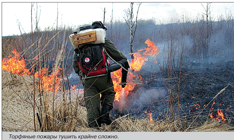
Торфяные пожары тушить крайне сложно.