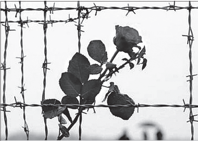
11 апреля в 11 часов у памятника узникам фашизма в Кипени состоится митинг, посвященный памятной дате.