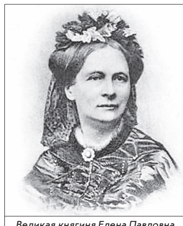
Великая княгиня Елена Павловна

Городской больнице жертвовали и богатые вельможи, и люди среднего достатка из числа ораниенбаумских горожан. Причём, помимо денег, лекарства, медицинского оборудования, преподносили и весьма любопытные дары. Так, в пожертвованиях герцо-