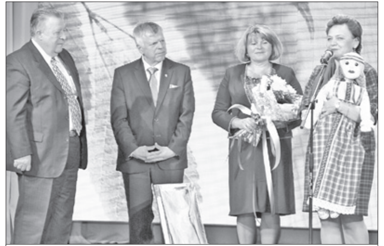
Поздравления от совета депутатов и администрации Ломоносовского района