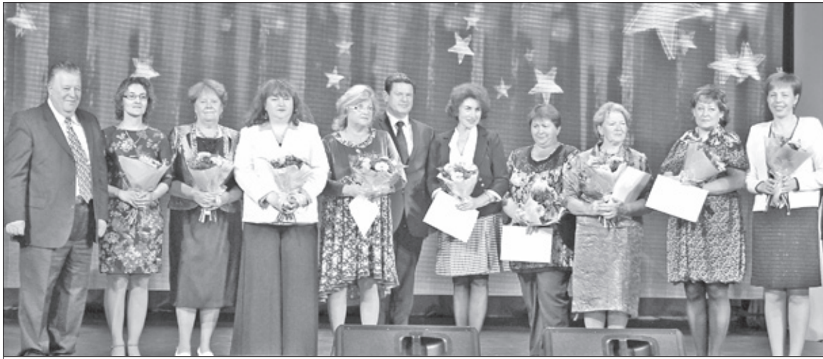
Сотрудники больницы, удостоенные наград областного Комитета по здравоохранению