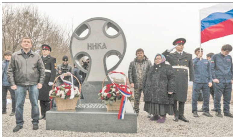
Поклонный крест на высоте 776