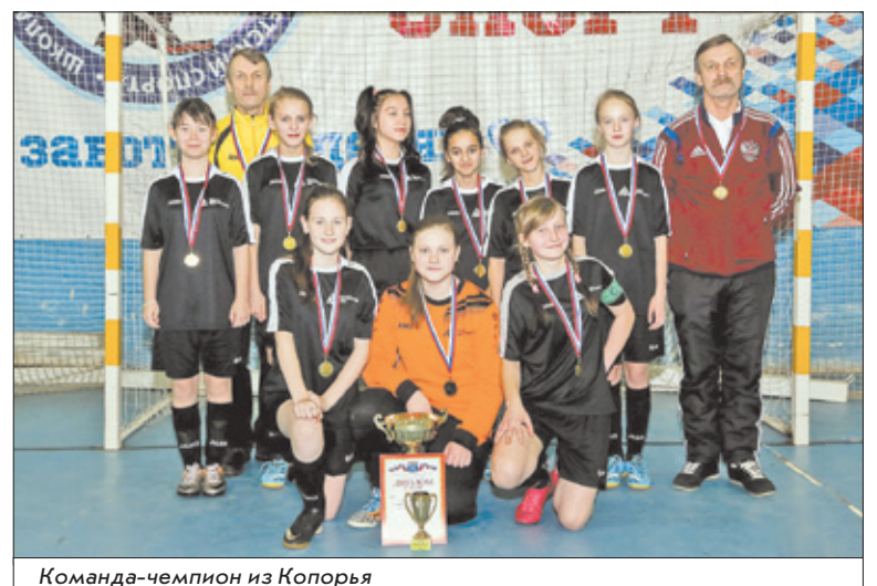
Команда-чемпион из Копорья