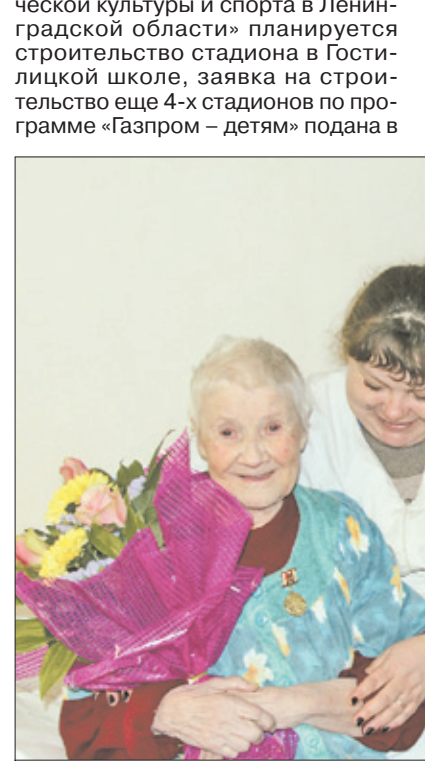
Поздравление ветеранов в стационаре Лебяженской больницы

правлениям: «юные экскурсоводы» и «взрослые экскурсоводы» (в мероприятиях «школы» приняли участие 30 человек); - реализован совместный проект «Копорье. Большая история для юных краеведов» (при участии физфака СПбГУ, Департамента по туризму Комитета по культуре Ленинградской области, Копорской СОШ). ● За 2016 год в отдел документооборота и организационной работы администрации района поступило на регистрацию 5677 обращений граждан, из которых 5587 – письменных и 90 – устных, полученных в ходе личного приема главы администрации муниципального образования Ломоносовский муниципальный район. ● Количество обращений в 2016 году увеличилось за счет поступающей корреспонденции по рассмотрению земельных ресурсов и вопросам по архитектуре и градостроительству. Лидирующее положение по тематике неизменно занимают обращения граждан по вопросам землепользования и распоряжения муниципальным имуществом.