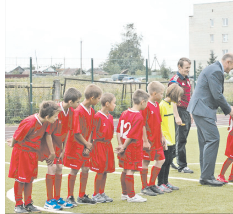
Открытие школьного стадиона в Копорье