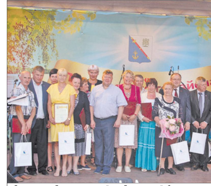
День рождения Ломоносовского района и Ленинградской области

областной Комитет по физической культуре и спорту. В 2016 году Ломоносовская детско-юношеская спортивная школа переведена в отремонтированное здание спортивного центра в д. Разбегаево, с обустроенным спортивным залом, медицинским кабинетом. Приобретен современный автобус на 22 места для организованных перевозок детских команд на соревнования. ● В 2016 году на проведение ремонтных работ и обеспечение комплексной безопасности направлено больше 34 млн.руб., из них почти 16 млн.руб. – средства депутатов Законодательного собрания Ленинградской области и депутатов муниципальных образований. ● В 2016 году выявлен и учтен 31 ребенок, оставшийся без попечения родителей.