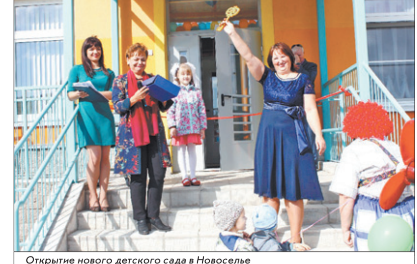
Открытие нового детского сада в Новоселье