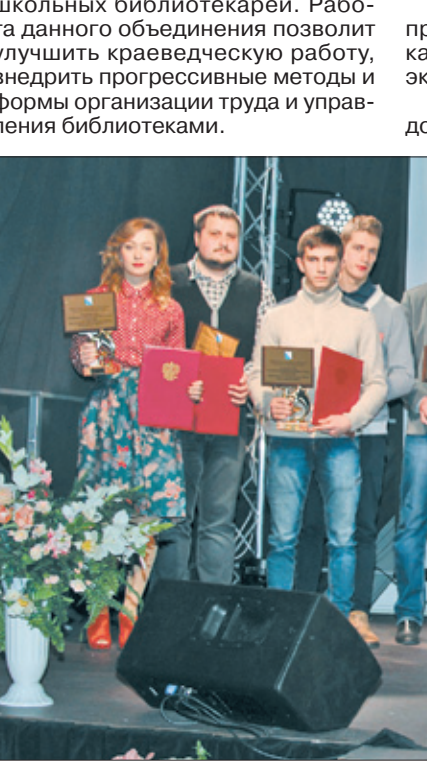
Награды за личный вклад в молодежную политику по итогам года