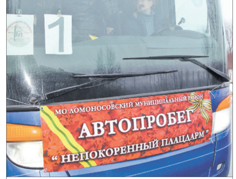
Автопробег по кольцу обороны Ораниенбаумского плацдарма