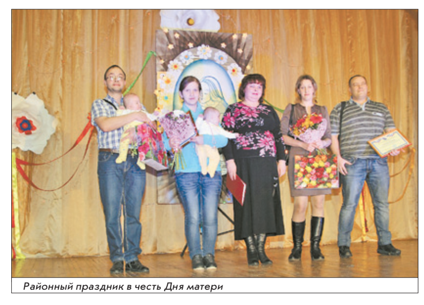
Районный праздник в честь Дня матери