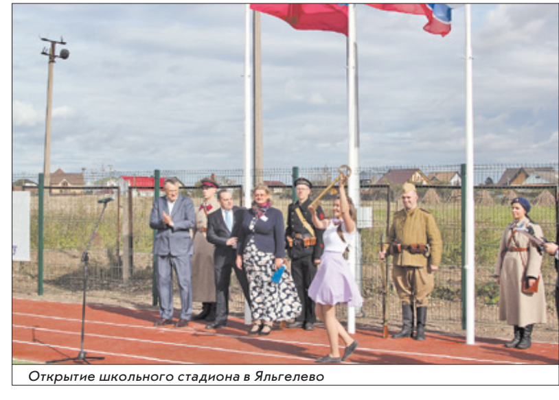
Открытие школьного стадиона в Ялгелево