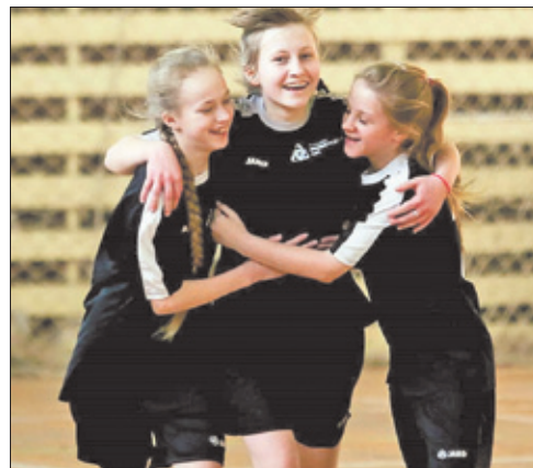
Незабываемые моменты Первенства России