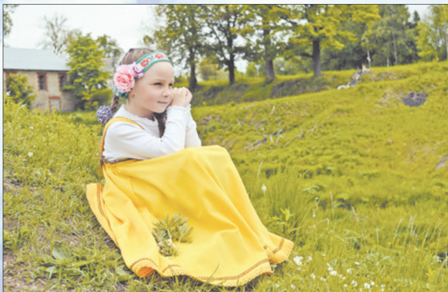
История в лицах.