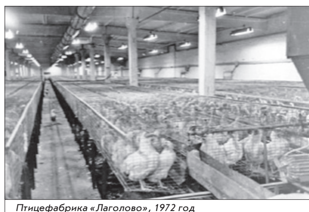
Птицефабрика «Лаголово», 1972 год

В 1949 году появилась возможность приобрести небольшую передвижную электростанцию с автономным двигателем. В школе, жилых домах и даже на мо-