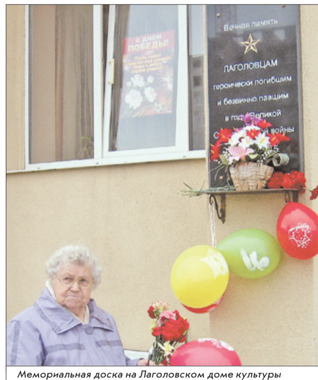
Мемориальная доска на Лаголовском доме культуры

А в январе 1950 года на базе подсобного хозяйства был создан совхоз «Лаголово».