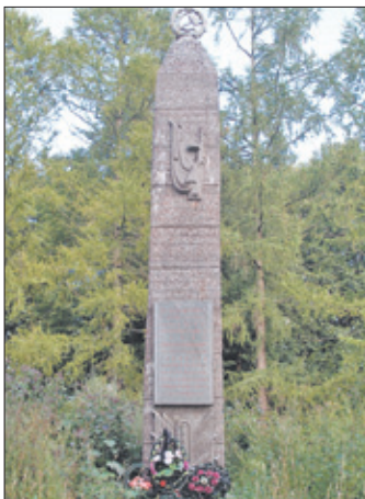
Обелиск на месте соединения частей советских войск в январе 1944 года