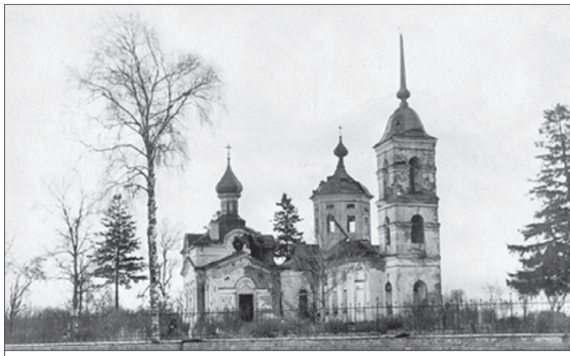
Таким был храм Николая Чудотворца в довоенное время