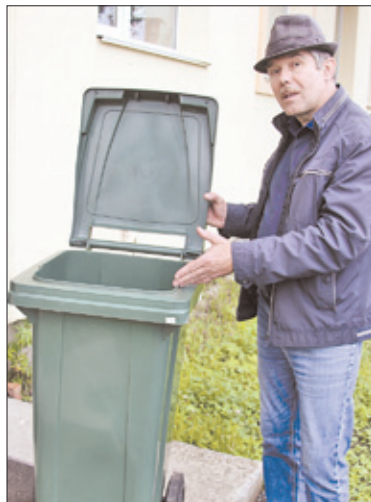
Такие контейнеры «Эко Лэнд» намерен предложить индивидуальным домовладельцам