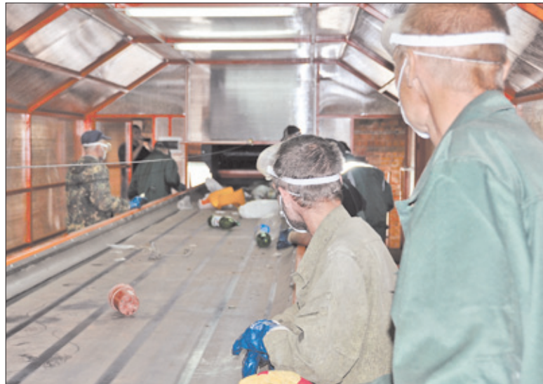
Линия обработки отходов на предприятии «Эко Лэнд»