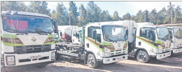
Парк спецтехники «Эко Лэнд» постоянно обновляется

Все больше и больше вокруг становится частных домовладений. И если «частник» несет свой мусор в контейнер, вывоз которого оплачен управляющей компанией (а средства УК собирает с жильцов многоквартирных домов в соответствии с установленным нормативом), то получается, что он фактически ворует.