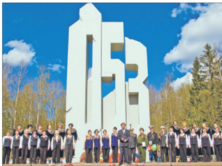
Мемориал «Непокоренная высота» на горе Колокольня