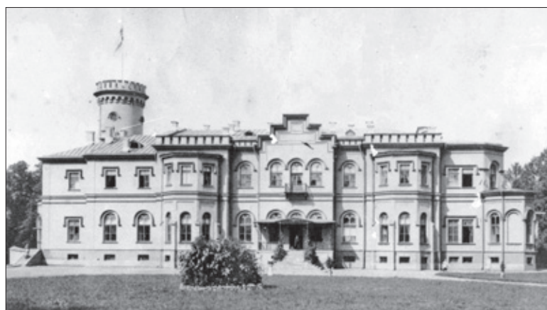
Гостилицы. Южный фасад дворца усадьбы

В Гостилицах каждый год 9 мая проходит районный праздник «День Победы». Здесь на мемориале похоронено более трех тысяч человек,