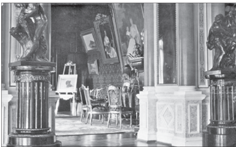
Интерьер большого зала дворца (архивный снимок)