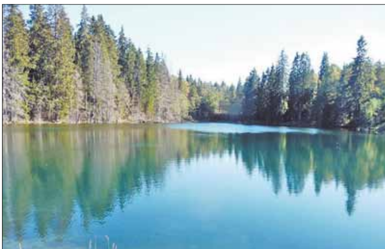
Лопухинское радоновое озеро

Лопухинка сегодня – это поселение с развитой инфраструктурой, численность населения которого свыше 3200 человек. На территории муниципального образования находится Лопухинская общеобразовательная средняя школа на 800 мест, Глобичская общеобразовательная средняя школа, детский сад №24 «Родничок», Лопухинская детская школа искусств, амбулатория, дом культуры. Предприятия в Лопухинском сельском поселении в основном сельскохозяйственного (например, КФХ «Савольщина») и рекреационного («Горки Гольф клуб», конный клуб «Усадьба Бахаревых») направлений.