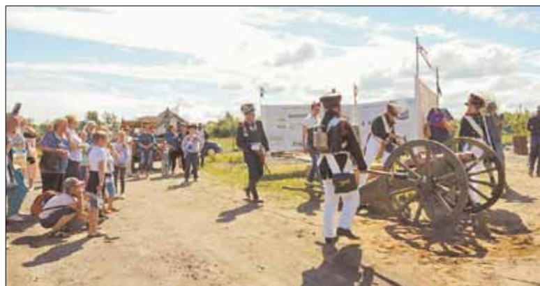
В Ломоносовском районе активно внедряют новые формы проведения экскурсий. На снимке – театрализованная историческая экскурсия с участием клуба реконструкторов-артиллеристов военно-исторического общества «Форт Красная Горка»

Мы понимаем, что самобытность, аутентичность – это то, что сегодня привлекает туристов и может являться стимулом для развития территории в целом. И таким стимулом является народное творчество, ремесло. Именно поэтому, каждый год в рамках праздника «Копорская потеха» проводится выставка-ярмарка «Копорский сувенир». В продолжение этой темы специалистами информационно-туристского центра (ИТЦ) Ломоносовского района организованы ежемесячные авторские выставки ремесленников Ломоносовского района, на презентацию которых приглашаются все желающие. Отзывы посетителей