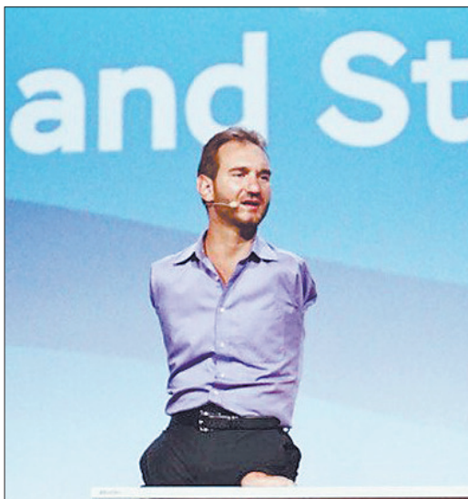
Знаменитый Ник Вуйчич

ВФМС-2017 запомнился яркими личностями, такими как Ник Вуйчич – известный мотивационный оратор и писатель. Этот человек имеет