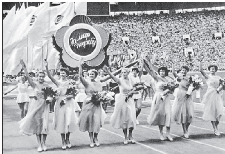
Исторический снимок с 6-го Всемирного фестиваля молодежи и студентов. Москва, 1957 год

Свою историю ВФМС начинает с 1947 года в Праге, но самым запоминающимся и масштабным стал VI Всемирный фестиваль молодежи и студентов, состоявшийся в 1957 году в Москве: когда разрушился «железный занавес» между СССР и странами Запада, а юноши и девушки увидели культуры других народов. Событие стало настоящим символом мира и единства и вселяло в сердца каждого надежду на светлое будущее и прекращение всех войн, включая «холодную». Именно в этот 1957 год в стране Советов впервые зазвучал рок-н-ролл, и начали входить в моду «варенки».