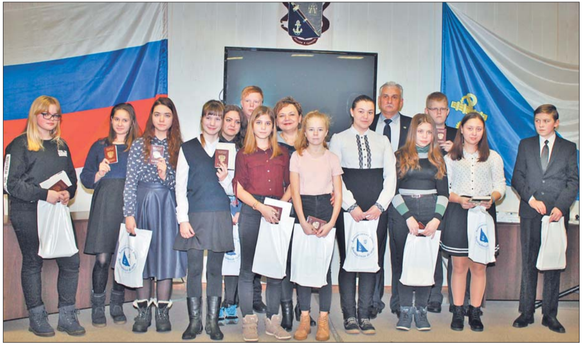
Торжественную церемонию получения первого паспорта организовали и провели специалисты