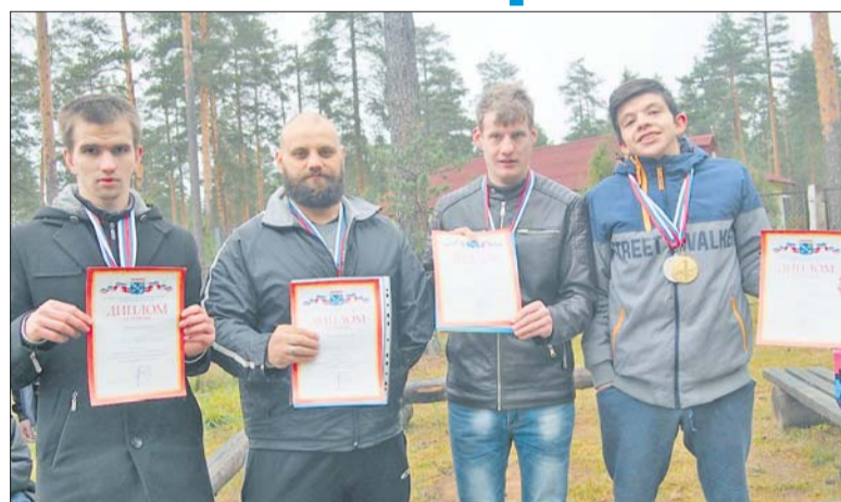
В 2018 году команда Ломоносовского района заняла почетное 3 место в Спартакиаде Ленинградской области для спортсменов с ограниченными возможностями.