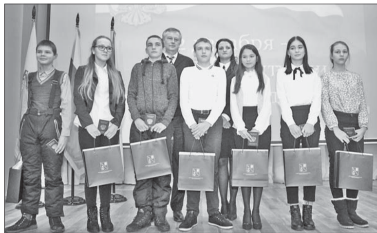
Губернатор вручил паспорта юным жителям Ломоносовского района