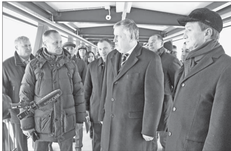
Губернатор вместе с руководителями Ломоносовского района и Аннинского городского поселения осматривает новый надземный переход

На приём к губернатору пришли люди с вопросами, требующими решения не только на областном, а на межрегиональном и даже на федеральном уровне: как остановить разрыв дороги на Красную Горку в поселке Лебяжье; как восстановить Ропшинский дворец и парк; как решить проблему владельцев участков, оказавшихся в охранной зоне системы водоснабжения фонтанов Петергофа... По всем вопросам губернатор определил пути решения и дал соответствующие поручения.