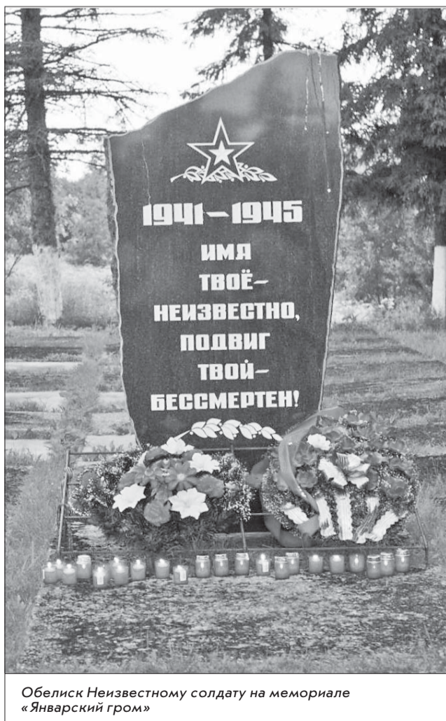
Обелиск Неизвестному солдату на мемориале «Январский гром»